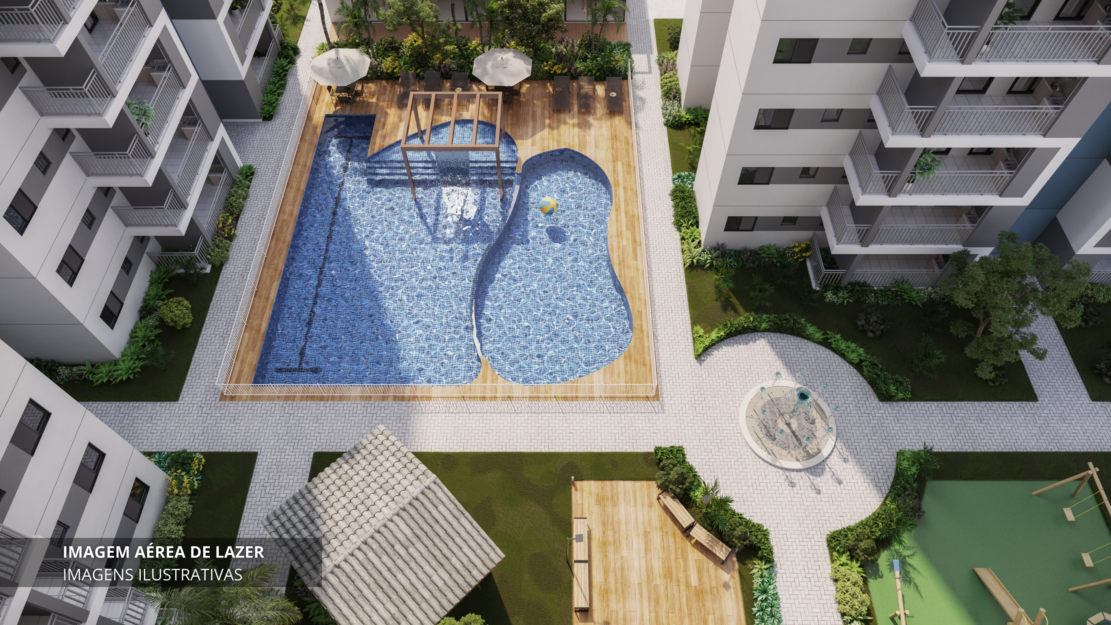
IMAGEM AÉREA DE LAZER IMAGENS ILUSTRATIVAS