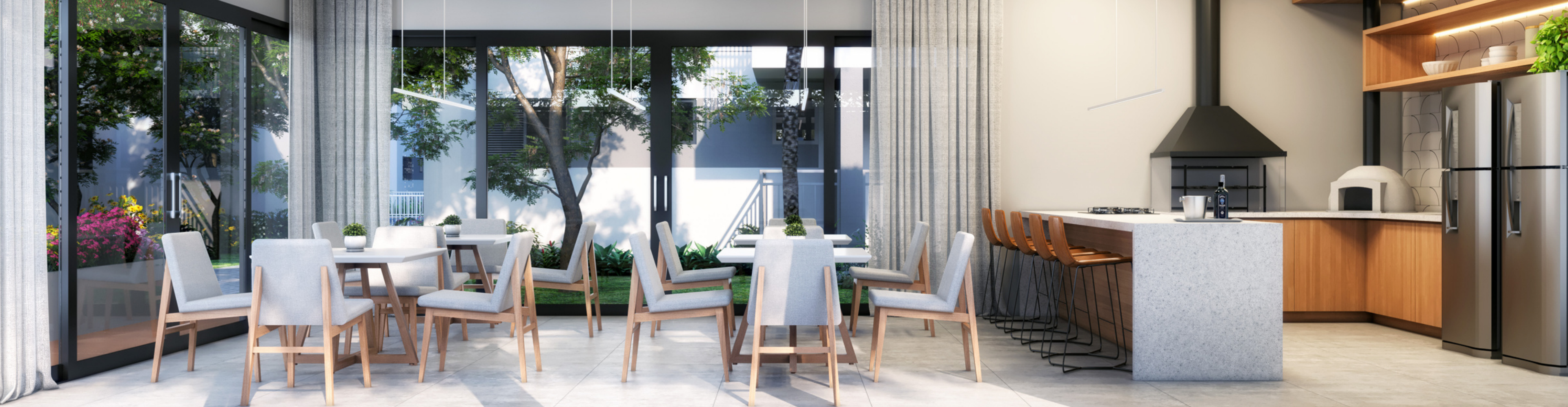
SALÃO DE FESTAS COM APOIO EXTERNO - DECK COM PERGOLADO